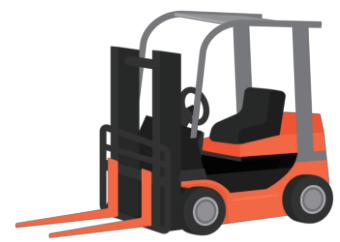
カウンターフォークリフト