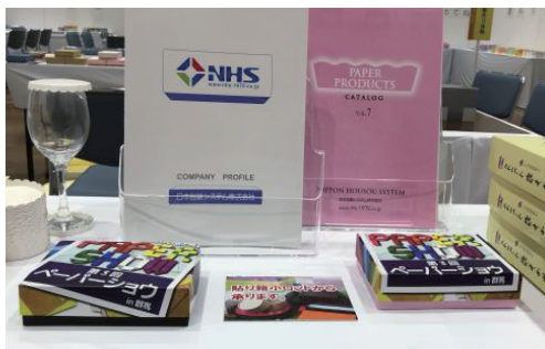
●ペーパーショウのポスターデザインで貼箱を作り体験を行っていただきました

今回ご来場いただきましたお客様、ペーパーショウは楽しんで頂けたでしょうか？2年後にもペーパーショウを開催する予定です。今回のペーパーショウにてご協力頂きましたアンケートやお客様の声を参考に、次回に繋げたいと思います。関心があったブースや商品、また気になった点などございましたら是非お聞かせいただければと思います。また、展示会で気になった商品がありましたら、サンプルや御見積もりをご用意させていただきますので、弊社の担当営業までお申し付け下さい。(み)