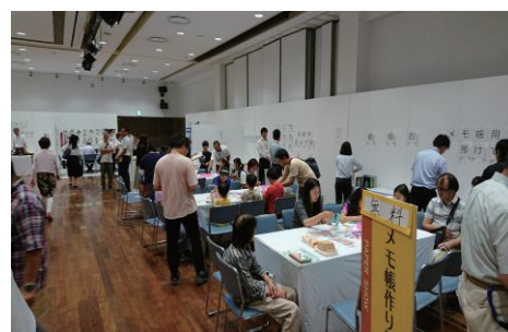
●メモ帳・しおり作りの様子

いくつかブースの紹介をしたいと思います。今回初出店の「道の駅 和紙の里ひがしちちぶ」は埼玉県で唯一の村の東秩父村にあり、大河原紙という伝統ある和紙の展示をしていただきました。また和紙で作られたコマやタペストリーの販売、和紙で作るメモ帳体験なども行っていただきました。